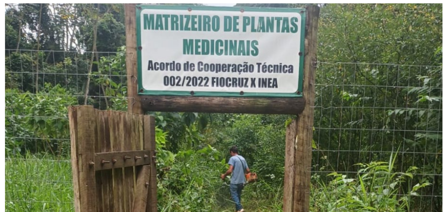
Imagem 09: Acordo de cooperação com o INEA tem o objetivo de promover a ampliação da representatividade de espécies endêmicas e fornecer mudas de plantas medicinais a diversos parceiros para implantação de Farmácias Vivas.

O Acordo de Cooperação técnica nº 002/2022 celebrado entre a Fiocruz e o Instituto Estadual do Ambiente (INEA) com vigência de