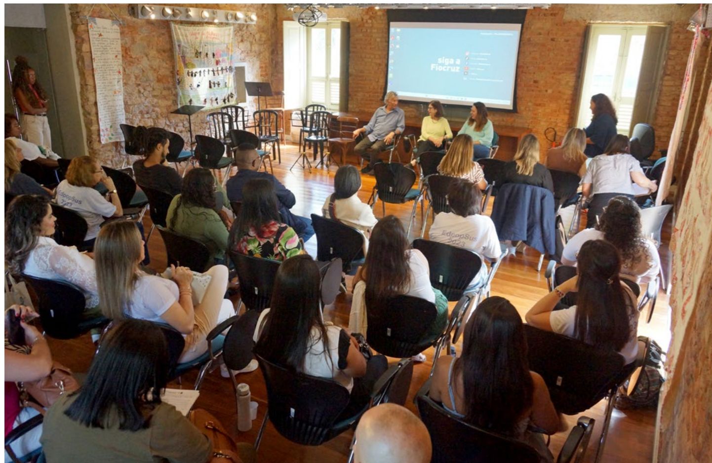
Imagem 15: Formatura das turmas do EdPoPSUS dos anos de 2019 e 2023. Ao todo (2017-2023), o curso já formou 153 educadores populares em saúde em suas 5 edições.

O evento contou com a participação de aproximadamente 50 formandos das duas turmas. A programação incluiu momentos de homenagem, depoimentos dos participantes, apresentação cultural da OCPIT e a entrega dos certificados de conclusão.