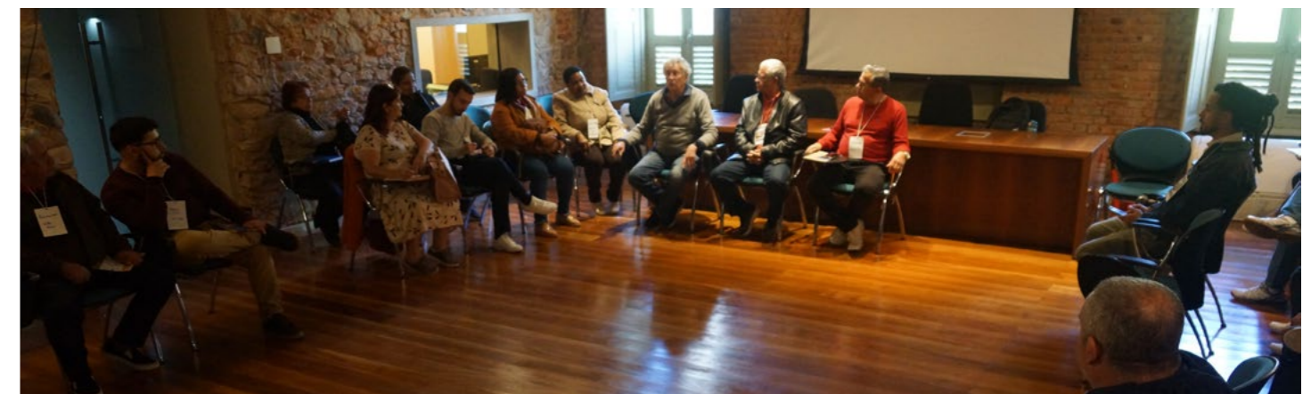
Imagem 10: Encontro de Associações de Moradores realizada em 27 de setembro de 2025 em parceria com a Federação de Associações de Moradores de Petrópolis e o Centro de Direitos Humanos do município.

O Censo Popular da Vila São José, uma iniciativa desenvolvida entre o Fórum Itaboraí e a Associação de Moradores, está em fase de pla-