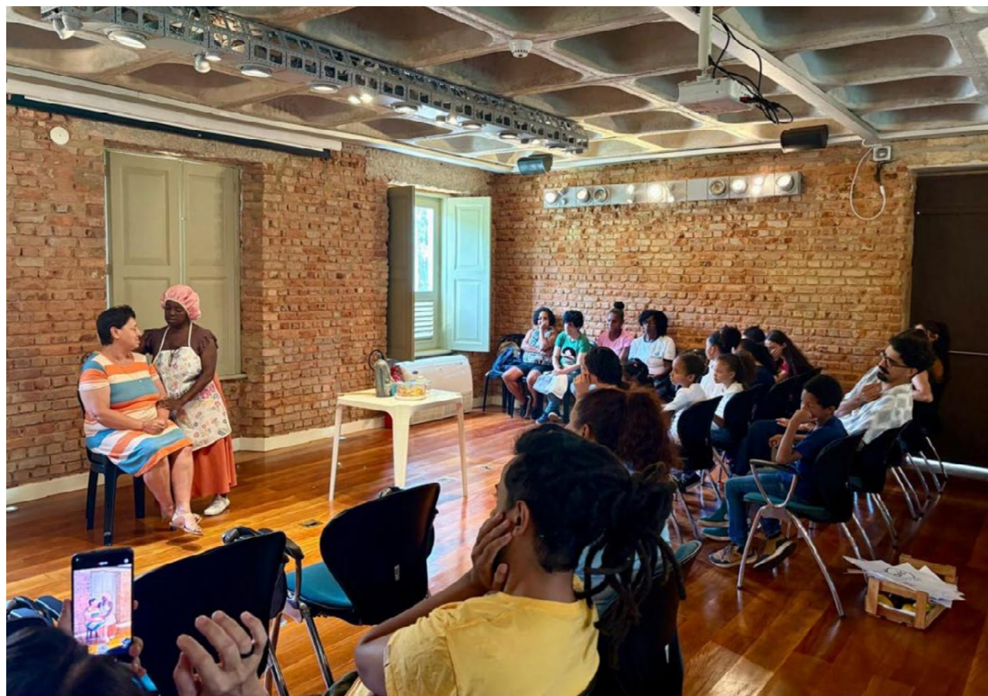
Imagem 03: O segundo Festival do Teatro do Oprimido (TO), realizado no dia 12 de dezembro, marcou o encerramento das aulas desenvolvidas ao longo do ano em três territórios da cidade: Vila Rica, Independência e Posse.

Os círculos de leitura tiveram como objetivos promover a leitura como prática cultural, crítica e afetiva; criar espaços de convivência e fortalecimento comunitário; e valorizar memórias, experiências e identidades locais, integrando a leitura, a expressão artística e o diálogo em