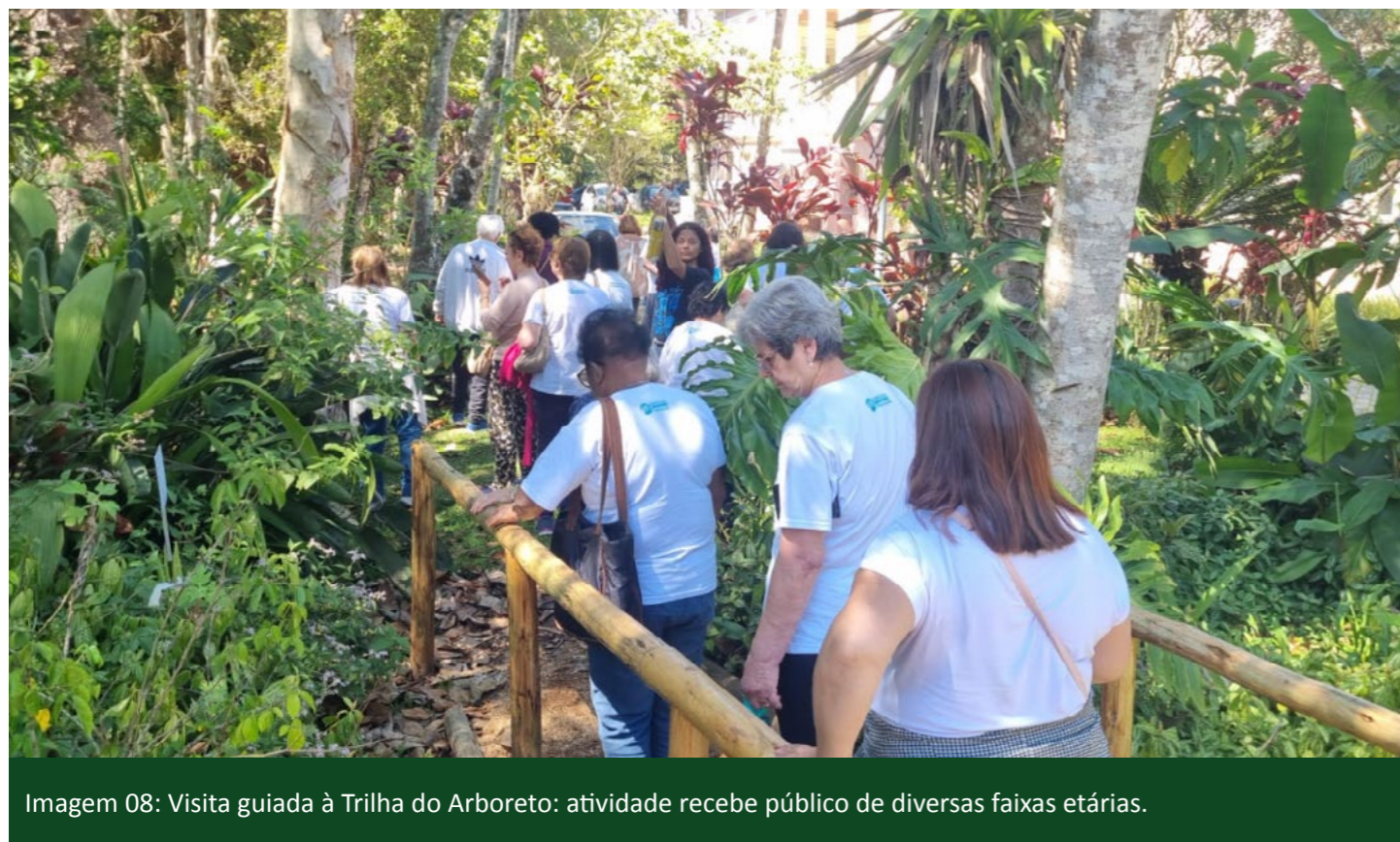
Imagem 08: Visita guiada à Trilha do Arboreto: atividade recebe público de diversas faixas etárias.

A trilha também conta com um minhocário, com minhocas vermelhas da Califórnia, destinado à doação de matrizes, além de uma composteira disposta em leira, responsável pela produção de substratos utilizados no manejo das espécies presentes no percurso.