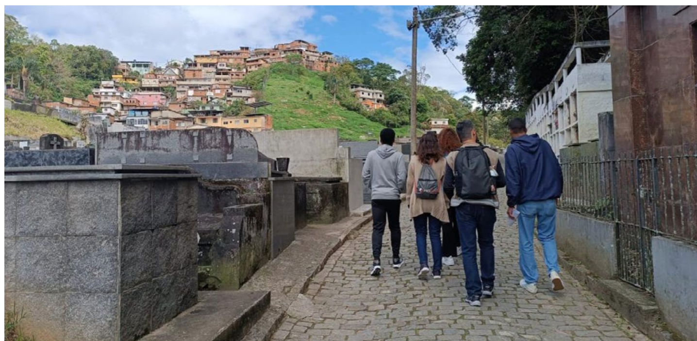
Imagem 12: Travessia realizada na comunidade Oswaldo Cruz em 24 de outubro de 2025 fez parte da capacitação de técnicas da Secretaria Municipal de Saúde de Vitória prevista no acordo de cooperação nº 68/2025.

Em outubro foi ministrada uma capacitação no Palácio Itaboraí para as duas técnicas da Secretaria Municipal de Saúde sobre a metodologia do trabalho. A atividade contemplou aulas teóricas e práticas sobre o processo de territorialização, desenvolvidas em duas comunidades de Petrópolis: Alto Independência e Oswaldo Cruz. Foram realizadas travessias territoriais e aplicadas metodologias do Diagnóstico Rápido Participativo (DRP) e da Cartografia Participativa, incluindo observação sistemática, visitas institucionais e demais técnicas previstas no DRP. Ao final do encontro, procedeu-se à avaliação das atividades desenvolvidas e à definição dos respectivos encaminhamentos.