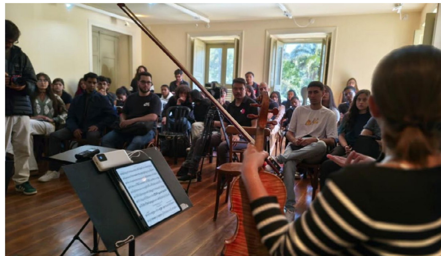
Imagem 02: O “Festival Viajart”, realizado em 27 de agosto de 2025, contou com uma programação diversificada com masterclasses de vários instrumentos, roda de conversa sobre intercâmbios e uma apresentação da Camerata Viajart.

Para a realização das matrículas, o responsável por cada aluno foi entrevistado com o objetivo de aprofundar as informações sobre a dinâmica familiar, a condição socioeconômica e a situação escolar e de saúde. Esses dados subsidiaram a equipe na formulação de estratégias de aproximação e no planejamento do processo de ensino-aprendizagem de cada estudante.