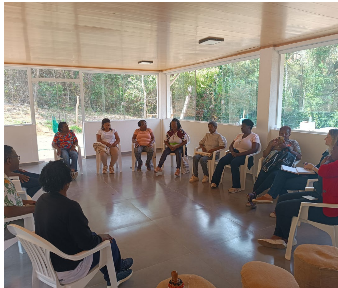
Imagem 11: As Rodas de Conversa realizadas no “Espaço Cultural Manoel Miquilina da Costa Barboza” tiveram o objetivo de estimular a reflexão sobre a realidade e possibilidades sobre atividades sustentáveis e criativas no território.

A oficina sobre confecção das bonecas Abayomi, momento em que as mulheres compartilharam lembranças e histórias marcantes em sua trajetória de vida, resgatam memória e fortalecem a identidade da mulher quilombola. Essa atividade revelou a potência do artesanato como pedagogia da ancestralidade. Da oficina de confecção das Abayomis, emergiram possibilidades concretas de geração de renda solidária, oficinas formativas, feiras culturais e exposições, fortalecendo o grupo como possibilidade de núcleo criativo e autossustentável, em que o fazer artesanal se converte em fonte de reconhecimento e valorização das mulheres negras do território.