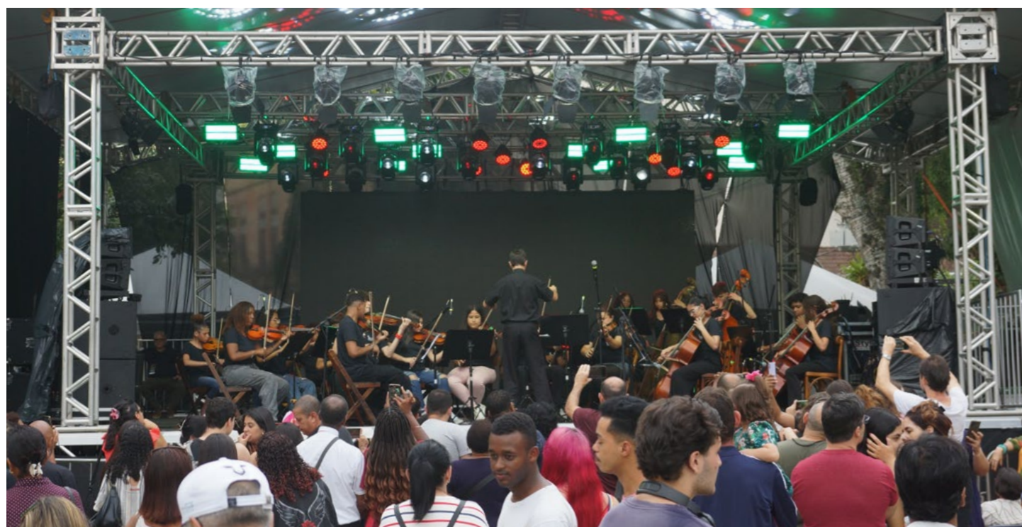
Imagem 01: Apresentação da OCPIT durante o evento “Natal Imperial”, realizada no dia 14 de dezembro de 2025.

A visita também buscou incentivar o diálogo entre música, artes visuais e história, contribuindo para uma formação artística mais ampla e sensível às múltiplas manifestações culturais do país.