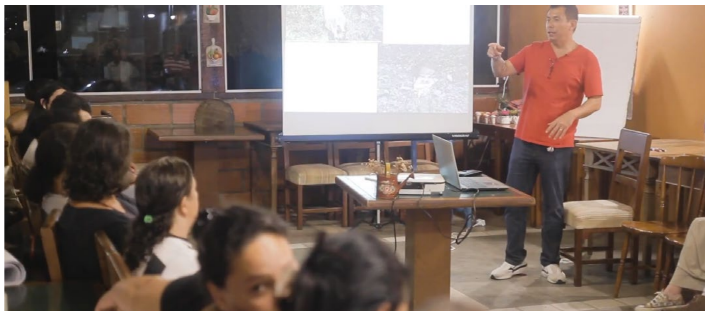
Imagem 16: Aulas teóricas fizeram parte da formação e capacitação do projeto “Águas do Brejal”. Formação completa (742 horas), certificado pela EPSJV/Fiocruz

Adicionalmente, o projeto prevê a aplicação piloto dessas metodologias em contextos reais, permitindo testar, validar e aperfeiçoar as propostas desenvolvidas, garantindo sua efetividade e possibilidade de replicação em diferentes municípios brasileiros.