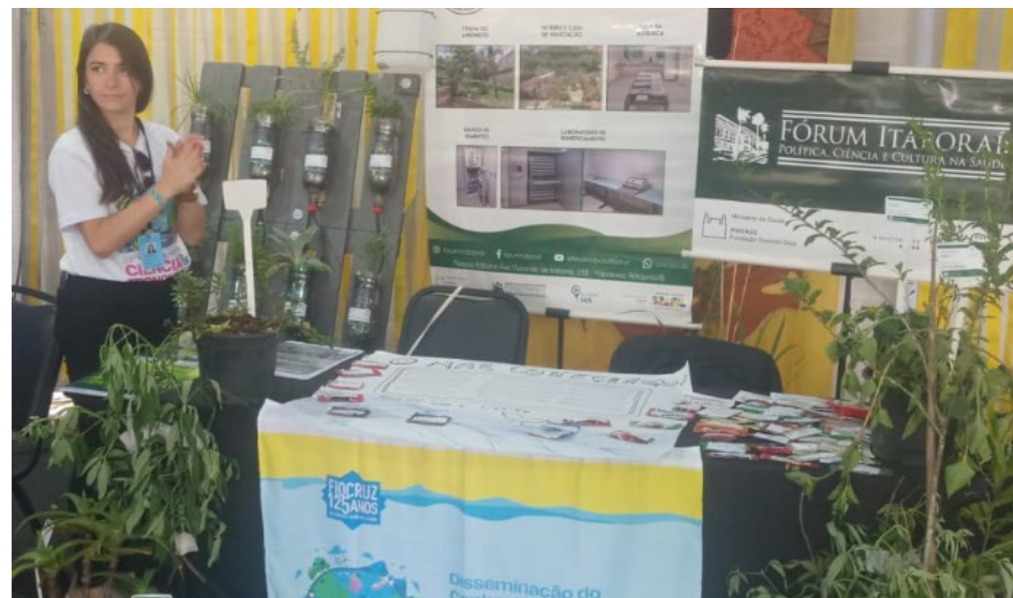
Imagem 07: Estande do Horto Escola na FioCruz Manguinhos durante a Semana Nacional de Ciência e Tecnologia.

O Horto-Escola foi estabelecido com a finalidade de expandir as oportunidades de capacitação para produtores e comunidades locais, oferecendo oficinas e palestras sobre identificação de espécies, semeadura, cultivo e processamento de plantas medicinais e PANC (Plantas Alimentícias Não Convencionais), servindo de