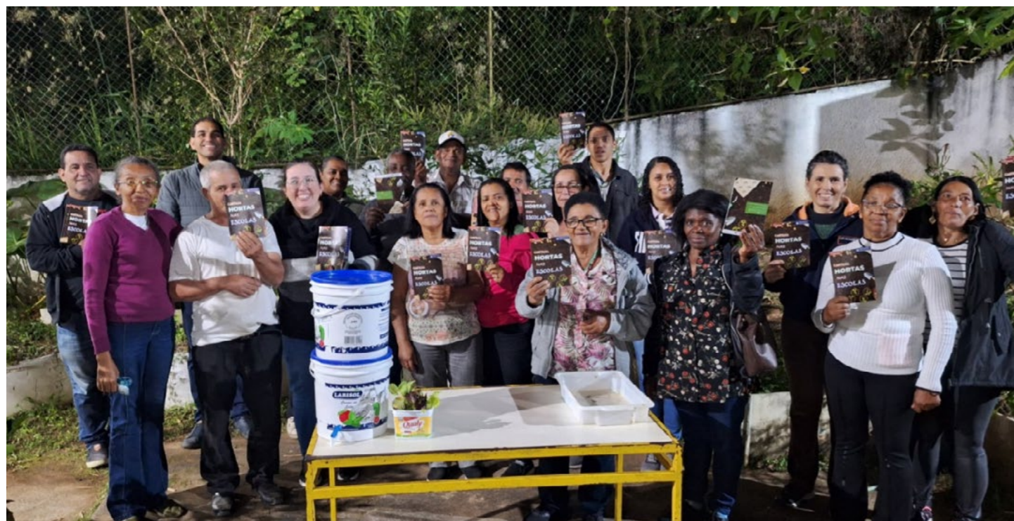
Imagem 05: Projeto “Hortas Escolares” já colaborou na implementação ou recuperação de 26 hortas em escolas públicas de Petrópolis. Iniciativa também oferece oficinas e visitas técnicas para auxiliar com a manutenção dos espaços.

No exercício de 2025, o projeto concentrou esforços nas etapas estruturantes, fundamentais para a implementação plena das ações previstas para 2026. No âmbito da Meta 1 – Identificação e seleção das famílias , foram realizadas