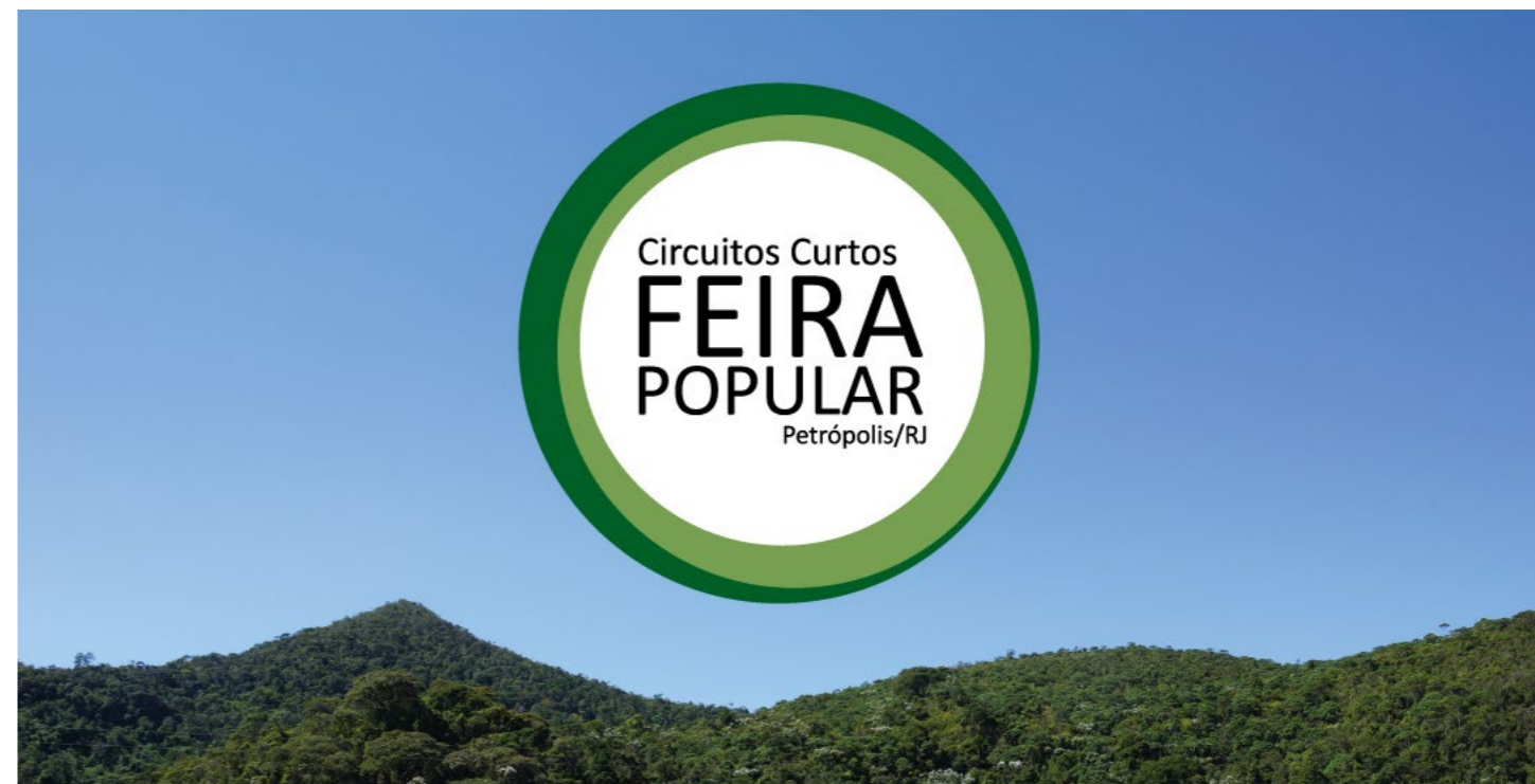
Imagem 06: A divulgação do projeto “Ações de Combate à Fome e Fortalecimento da Agricultura de Base Agroecológica em Petrópolis” focará nos conceitos de circuitos curtos e feiras populares.