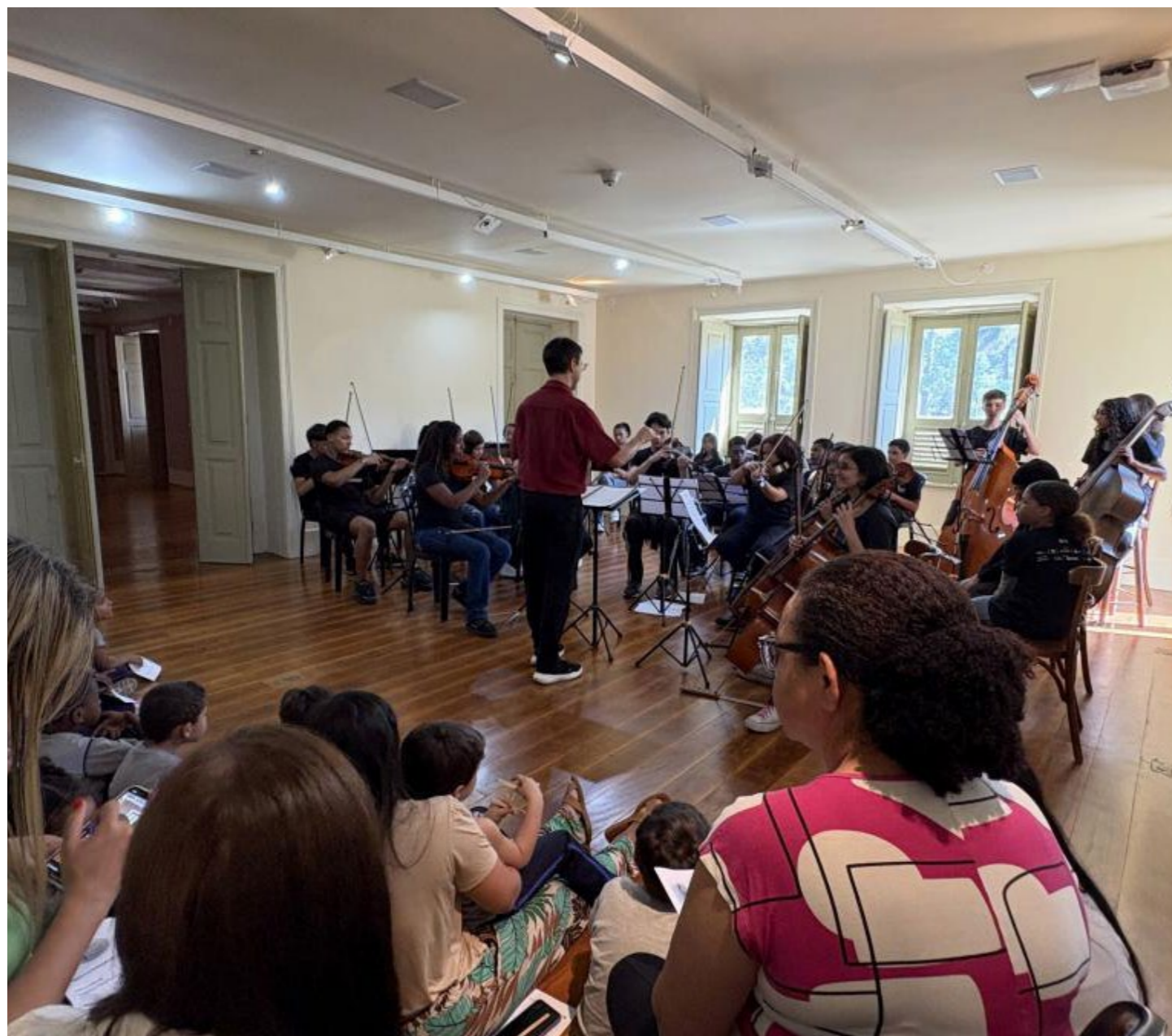
Imagem 04: O “Orquestrando Histórias” é apresentado para crianças e adolescentes de escolas públicas de Petrópolis, promovendo o acesso à leitura e despertando o interesse pela música orquestral.

Ao final das oficinas, foram doados 92 livros aos participantes, fortalecendo o incentivo à leitura e promovendo o acesso ao livro.