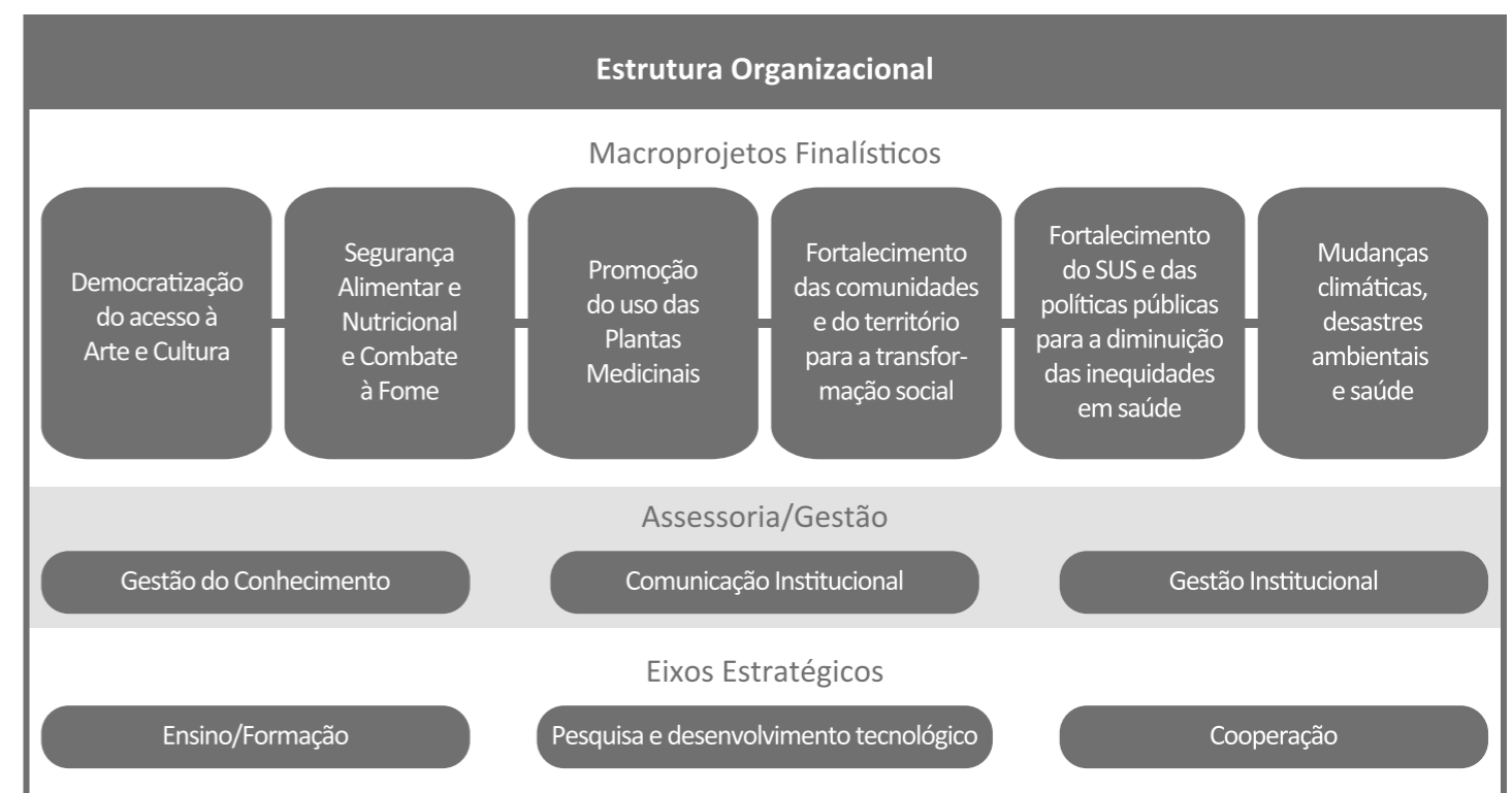
Quadro 01: Estrutura Organizacional

(a versão digital possui atalhos abaixo das imagens para retornar à página relacionada)