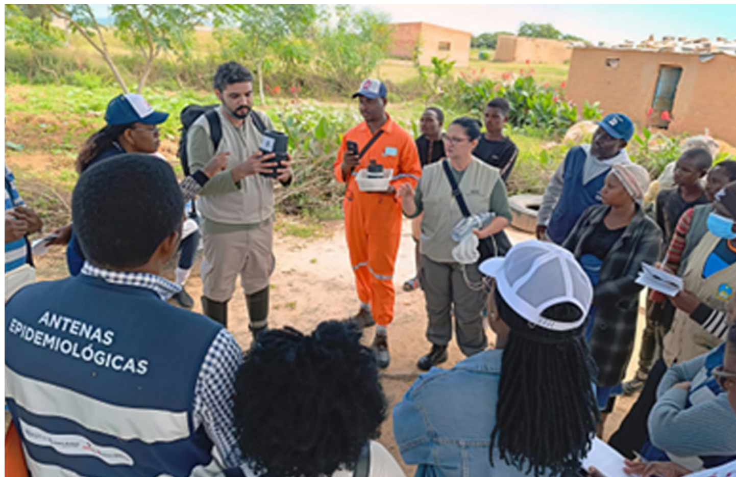
Imagem 18: Projeto da Carta Entomológica de Angola atua na formação básica de profissionais angolanos em Entomologia Médica, coleta e armazenamento de material e gerenciamento de banco de dados e divulgação científica.

Neste período foram realizadas duas expedições à Angola, a primeira em abril e a segunda em agosto, ambas com a finalidade de realizar a elaboração de banco de dados de coletas de amostras de artrópodes vetores de interesse médico, bem como a capacitação em uso de geotecnologias para coleta de dados em campo. Após as expedições foram realizados o tratamento e gerenciamento de dados coletados e levantados, além da geração de mapas das coletas e de mapas a partir de dados secundários de artrópodes vetores de interesse médico para subsidiar a elaboração de um relatório técnico do projeto. Além disso, foi elaborado um guia prático de coleta de dados entomológicos e uma proposta de curso de banco de dados e geoprocessamento básico.