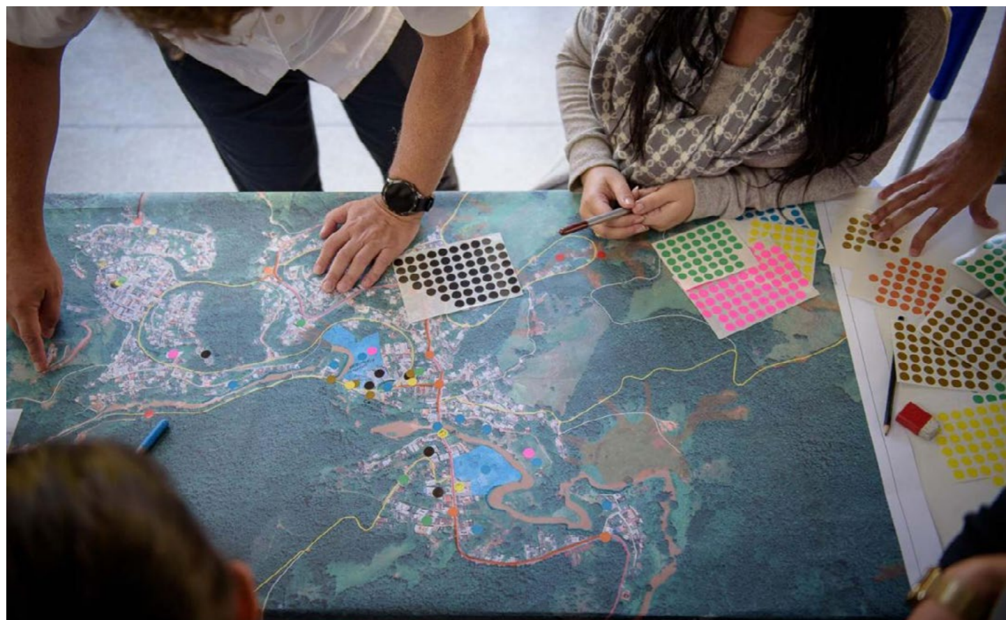
Imagem 17: Projeto DUI-RRD tem como objetivo a elaboração de um manual com metodologias para intervenções urbanas e fortalecimento das estratégias nacionais para redução de riscos de desastres.