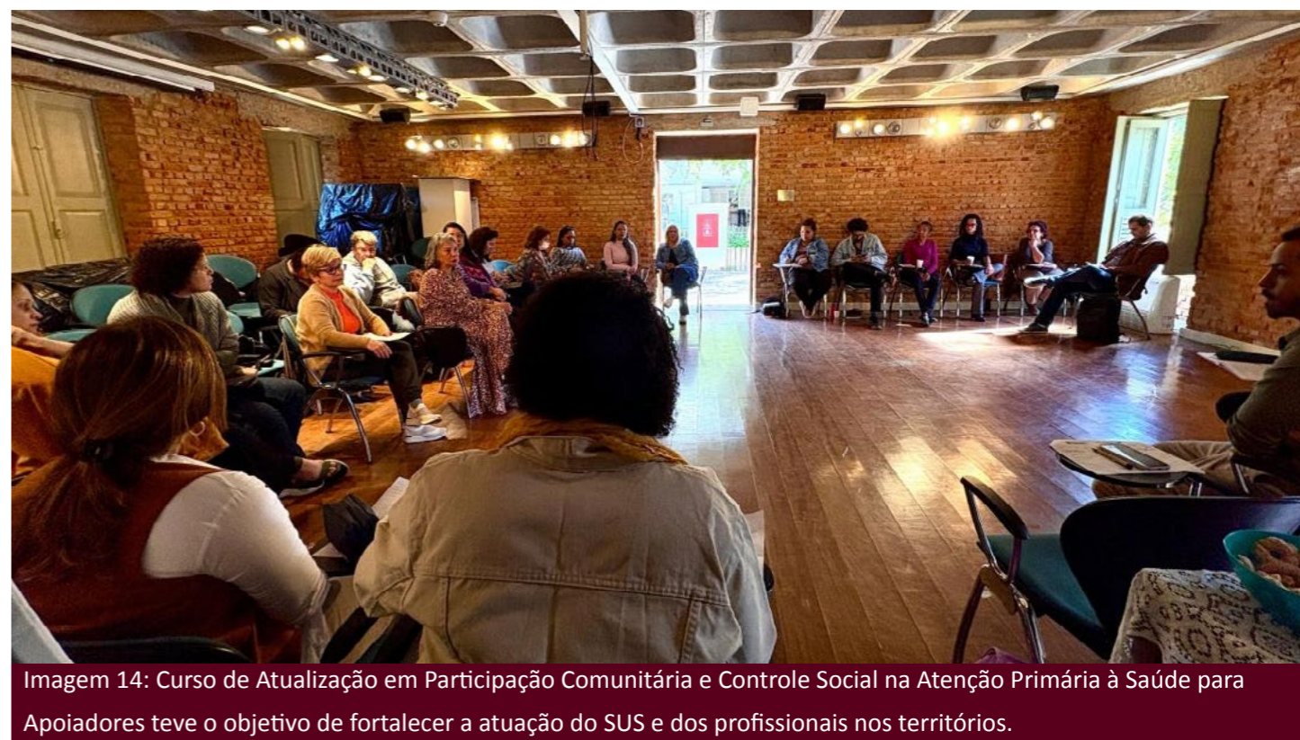
Imagem 14: Curso de Atualização em Participação Comunitária e Controle Social na Atenção Primária à Saúde para Apoiadores teve o objetivo de fortalecer a atuação do SUS e dos profissionais nos territórios.