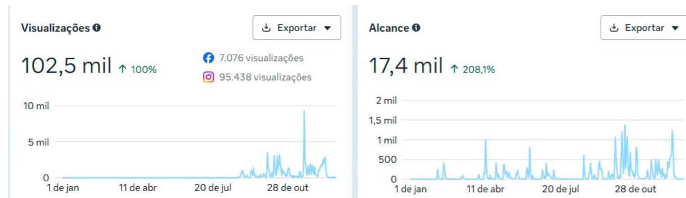
Imagem 19: Resultados do Instagram institucional do Fórum Itaboraí em 2025 - Crescimento foi impulsionado pela maior utilização estratégica de ferramentas digitais, principalmente durante o período de problemas orçamentários.

O quadro da página 77 , disponível para consulta, apresenta a produção e o alcance de algumas ferramentas utilizadas pelo NIC ao longo de 2025.