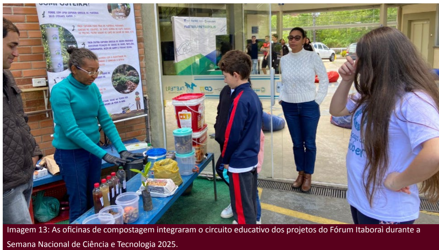
Imagem 13: As oficinas de compostagem integraram o circuito educativo dos projetos do Fórum Itaboraí durante a Semana Nacional de Ciência e Tecnologia 2025.

O curso teve o objetivo de constituir um ambiente pedagógico para reflexão crítica sobre o fortalecimento do controle social e da participação comunitária como um princípio do SUS e a centralidade dos Apoiadores da APS e dos Agentes Comunitários de Saúde neste processo. Com uma carga horária de 30hs e modalidade presencial, o curso foi realizado no período de 09/05/2025 a 27/06/2025 para 19 participantes. Os encontros foram realizados nas dependências do Palácio Itaboraí.